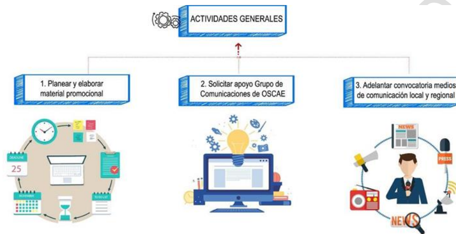
Ilustración 2. Actividades de divulgación RNPC.

A continuación, se describe el conjunto de actividades que debe adelantar el equipo de Comunicaciones del GTARNPC a nivel general, para difundir las acciones que se llevan a cabo en los programas Casas del Consumidor de Bienes y Servicios Regional, Casas del Consumidor de Bienes y Servicios Bogotá, Ruta Nacional de Protección al Consumidor La Estrategia de Diálogo con Economías Populares y CONSUFONDO.