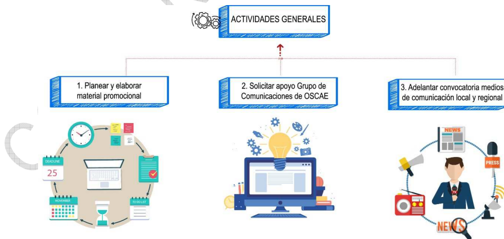
Ilustración 2. Actividades de divulgación RNPC

A continuación, se describe el conjunto de actividades que debe adelantar el equipo de Comunicaciones del GTARNPC a nivel general, para difundir las acciones que se llevan a cabo en los programas Casas del Consumidor de Bienes y Servicios Regional, Casas del Consumidor de Bienes y Servicios Bogotá, Ruta Nacional de Protección al Consumidor, Diálogo Ciudadano y Consufondo.